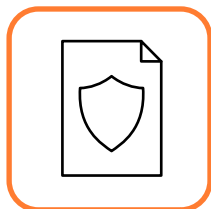
Piano di protezione